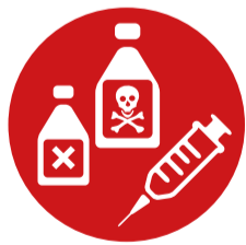
Giftige Stoffe und ansteckungsgefährliche Stoffe