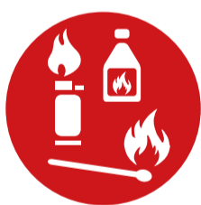
Entzündbare flüssige und feste Stoffe