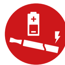
Lithium Metall Batterien bis 2 g Lithium und Lithium Ionen Akkus bis 100 Wh

dürfen sowohl im Handgepäck als auch im aufgegebenen Gepäck transportiert werden, wenn sie in einem elektronischen Gerät verbaut sind (z. B. in Laptops, Tablets, Kameras). Ersatzbatterien und -Akkus dürfen nur im Handgepäck transportiert werden. Powerbanks gelten als Ersatz. Auch E-Verdampfer dürfen nur im Handgepäck transportiert werden.