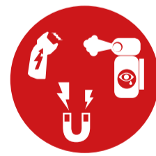
Verschiedene gefährliche Stoffe und Gegenstände